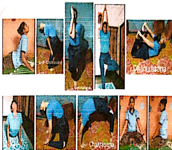
Rayat Shikshan Sanstha's Arts, Science and Commerce College, Ramanandnagar(Burji)